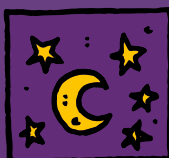
od soumraku do úsvitu